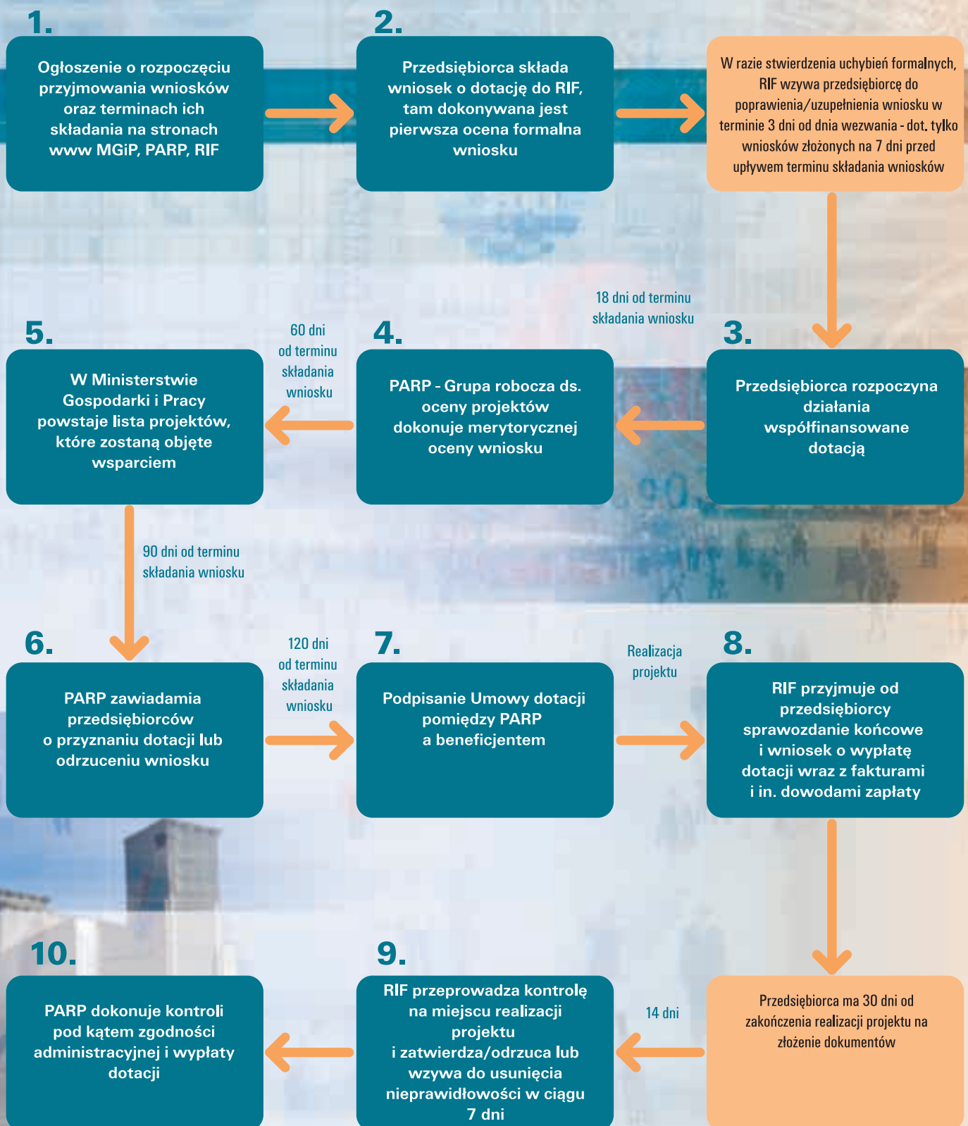
Wykres nr 4 - Przykładowa droga wniosku dla Działania 2.3.